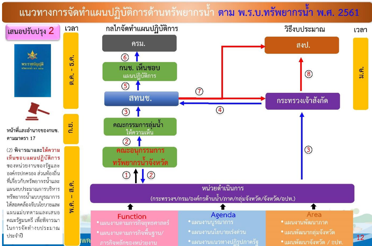
รูปแสดงแนวทางการจัดทำแผนปฏิบัติการด้านทรัพยากรน้ำ ตามพระราชบัญญัติทรัพยากรน้ำ พ.ศ. ๒๕๖๑

๑.๘ กระทรวงเจ้าสังกัดของหน่วยงานของรัฐและองค์กรปกครองส่วนท้องถิ่นนำแผนปฏิบัติการที่ผ่านความเห็นชอบจาก กทช. และคณะรัฐมนตรีเสนอขอรับจัดสรรงบประมาณประจำปีต่อสำนักงบประมาณ